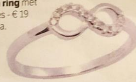
Zilveren ring met steentjes - € 19 - Victoria.