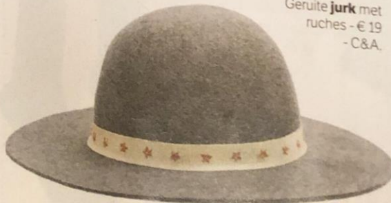
Grijze vilten hoed - € 17,99 - Mango.