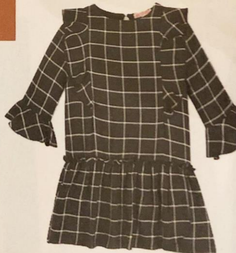
Geruite jurk met ruches - € 19 - C&A.

↓ Geruite blazer - € 99,90, bruine riem - € 29,90, beige midirok - € 39,90 en sjaal - € 49,90 - Ines de la Fressange x Uniqlo.