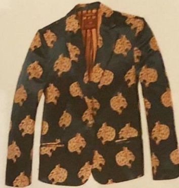
Blauwe satijnen blazer met panters - € 129,95 - Scotch & Soda R'Belle.