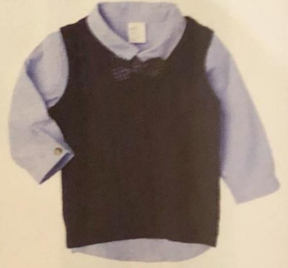
Lichtblauw hemdje met debardeur en strik - € 19,99 - H&M.