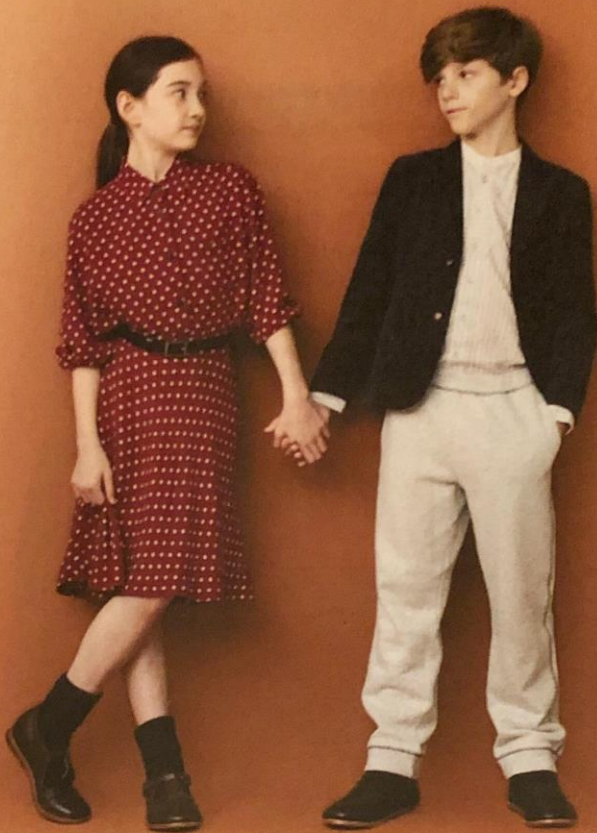
Meisje: rode bloes met bolletjes - € 19,90 en bijpassende rok - € 29,90 - Ines de la Fressange x Uniqlo. Jongen: blauwe fluwelen blazer - € 79,90, gestreept hemd - € 19,90 en joggingbroek - € 19,90 - Ines de la Fressange x Uniqlo.

Ook kids kunnen schitteren in een chic tenue met een vleugje retro. Ga voor volwassen prints en rijkelijke materialen als satijn en suède. Oh, en vergeet die dandyeske accessoires niet.